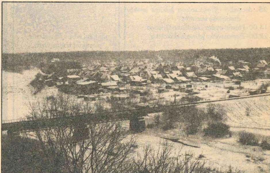
Līvāni ziemā.