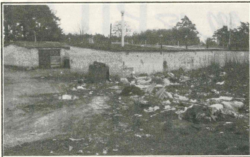
Izgāztuve pie garāžu kooperatīva Nr 7 Zemgales ielā.

Par garāžu kooperatīvu teritorijas sakopšanu ir atbildīgi garāžu kooperatīvu biedri, diemžēl, bieži vien vainīgi apkārtnes piegružošanā ir apkārtējo māju iedzīvotāji.