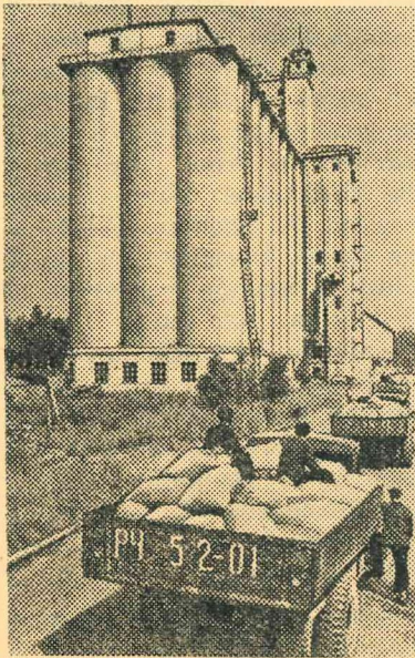
Attēlā: mašīnas ar labību piebraukušas pie elevatora.

Tatārijas Autonomā Republika. Kazanas elevatorā ik dienas nepārtraukti pieved no republikas kolhoziem un padomju saimniecībām jauno ražu.