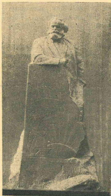
Attēlā: Kārļa Marksa pieminēkļa projekts.

Pieminekli uzstādīs Maskavas centrā, Sverdlova laukumā. Pirmā prēmija piešķirta autoru skulptora b. Kerbera, arhitektu bb. Begunca, Kovaļčuka, Makareviča un Morgulisa projektam.