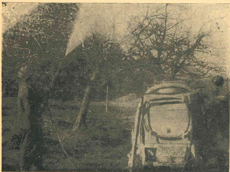
Stalīna kolhozā šoruden mīglo augļu dārzus, lai iznācinātu kaitēkļus.