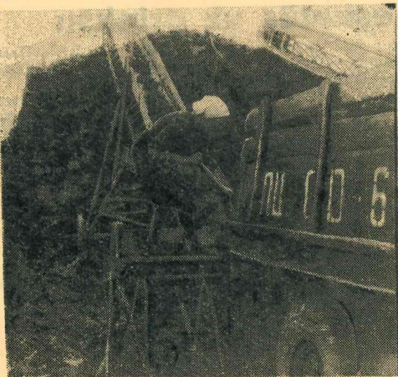
Attēlā: pie rūpniecības pievesto kūdras krauj krātnēs ar transportiera palīdzību.

Labi kurināmā sagāde sezonai noris Līvānu spirta rūpniecībā. Rūpniecības kolektīvs gatavo jau 1166 tonnas kūdras un 1150 kubikmetru malkas. Pašlaik kurināmo gatavo jau vīrs plāna.