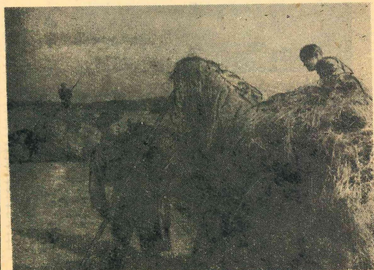
Attēlā: Stajlva kolhoza II brigādes kolhoznieki ved sienu.