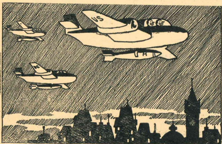
— Bet ja nu pēkšņi nokritis šī lietīņa? — Tas nekas. Mēs taču neesam mājās.