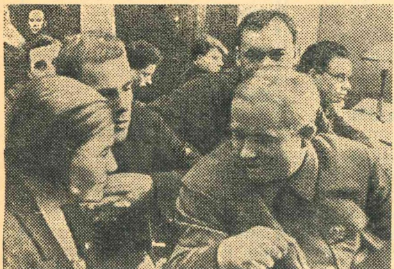
Attēlā: N. Hruščovs jaunogļraču stahano vīešu salidojuma dalībnieku vidū Tulā 1936. gadā.

tos uzcēla pilsētu un nosauca to komjaunatnes vārdā — Komsomoļska.