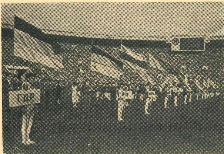
Maskava. 8. jūlijā Centrālajā Leņina v. n. stadionā beidzās 14. pasaules meistarsacīkstes sporta vingrošanā vīriešiem.