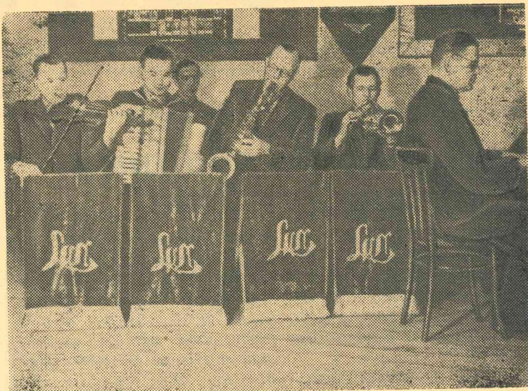
Attēlā: Kultūras nama estrādes orķestra dalībnieki mēģinājumā.

Vēls vakars. It kā no tālēm vakara klusumu piepilda vijīgu melodiju maigie akordi. Tos nomaina uzmundrinoša takts — ritmis, kad, kā saka, kājas cilājas pašas.