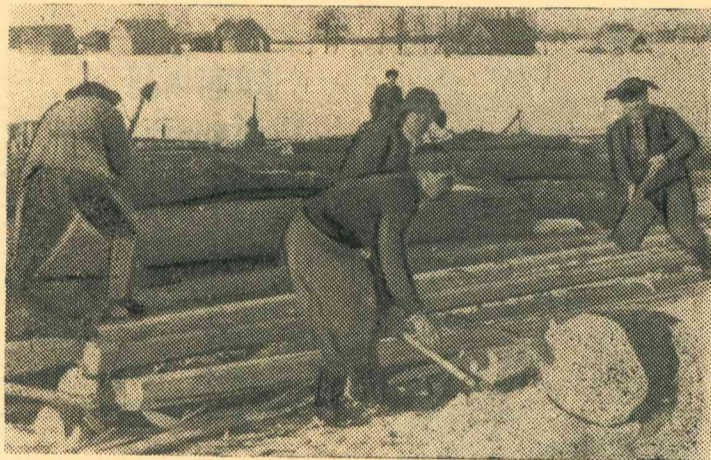
Attēlā: kolhoza „Sarkanais karogs“ būvbrigāde sagatavo kokmateriālus kolhoza celtniecības vajadzībām.