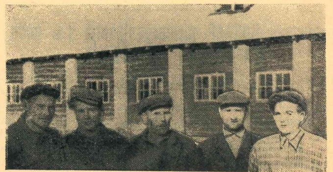
Attēlā: kolhoza „Draudzīgais maijs” celtnieku brigāde.

Sagaidot Lielās Oktobra sociālistiskās revolūcijas 41. gadadienu, krietnu velti savam dzimtajam kolhozam „Draudzīgais maijs” apņēmas dot kolhoza celtnieku brigāde. Skaitliski nelielā būvbrigāde deva vārdu novembra pirmajā pusē nodot lietošanā labiekārtotu liellopu fermu, kurā varēs ievietot vairāk nekā 80 govus. Šajās dienās būvdarbus celtnieki pabeigs. Jaunajā fermā būs mehanizēta mēslu izvešana un barības piegāde. Pašlaik kolhozs pabeidz jaunās kūts elektrifikāciju. Tuvākajās dienās fermā izvietos kolhoza govus.