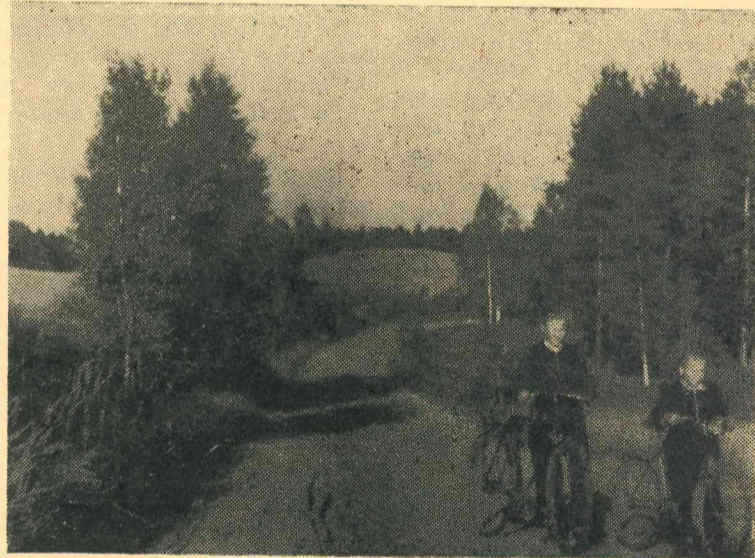
Skaista ir daba rudens saules zeltainā mirdzumā.