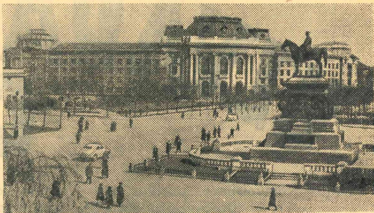
Attēlā: Sofijas universitātes ēka. Priekšplānā Tautas sapulces laukums.