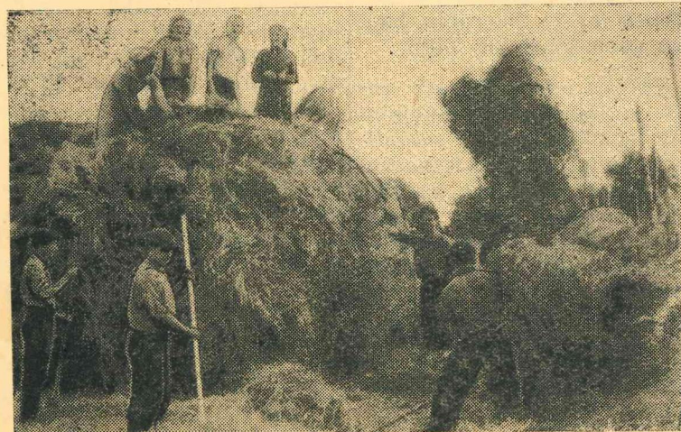
Kolhoza „Sarkanais karogs” kantora un Turku ciema padomes darbinieki ir bieži palīgi kolhoza darbos.