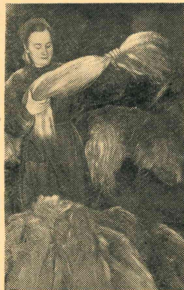
Attēlā: F. Ivanova šķiro linus. Maiņas uzdevumus viņa izpilda par 140—150 procentiem.