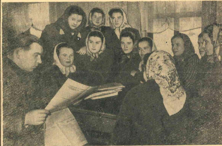
Preiļu rajona lauksaimniecības arteļa „Krasnij Oktjabrj” agitatoru kolektīvā darbojas 13 cilvēki. Viņi bieži ierodas pie kolchozniekiem mājās, rīko pārrunas.

Preiļu lina fabrikas kolektīvs janvārī atzīmēja uzņēmuma darba 5. gadadienu. Taču lina fabrikas produkcija jau pazīstama daudzos Padomju Savienības tekstilrūpniecības uzņēmumos. Fabrikā plaši izvērstā socialistiskā sacensība par godu vietējo padomju vēlēšanām. Visas brigades pārsniedz uzdevumus, dod labas un teicamas kvalitātes produkciju.