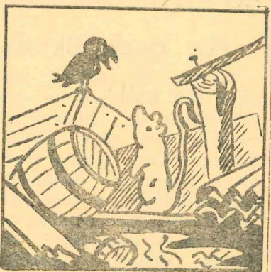
Suns vārni:—Tu sēdi augstāk, paskaties, kurš pagalmis tirāks? Vārni:—Sēdi vien tepat. Visur vienāds skats.