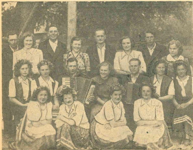
Attēlā: kolchoza „Strauts“ pašdarbnieki.

Rajona darba laudis! Abonējiet savu rajona laikrakstu „UZVARAS CEĻŠ“ nākamajam pusgadam Abonēšanas maksā pusgadā Rbl. 7.80