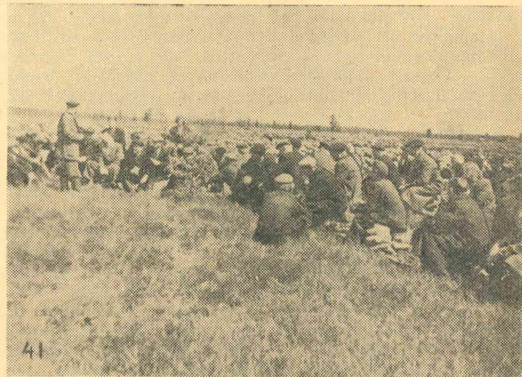
Rajonā vislabāk pakaišu kūdras ieguve organizēta Staļina vārdā nosauktajā kolchozā. Nesen te notika rajona kolchozu priekšsēdētāju un lauksaimniecības speciālistu seminārs. Attēlā: semināra dalībnieki dalās darba pieredzē.