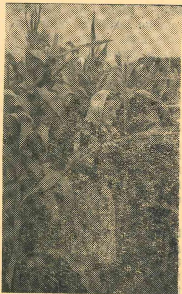
Attēlā: Zenta Vērdiņa apskata pašas izaudzēto kukuruzu.

Šogad daudzi Latvijas kolchozi izaudzējuši labu kukuruzas ražu, ko ieskābēs sabiedriskās lopkopības vajadzībām. Kukuruzu lauksaimniecības arteļos parasti audzē lielus masīvos — no 6—30 un vairāk hektāru katrs. Šogad kolchoznieki pēc pašu ierosmes sākuši sēt kukuruzu arī nelielos laukos, netālu no kolchoznieku piemājas zemes. Sasniegti teicami rezultāti — kukuruzas sējumi paplašināti un palielinājusies skābbarības ražošana sabiedriskajai lopkopībai. Balvu, Gulbenes un daudzos citos rajonos kukuruzu nelielās platībās pie saviem piemājas zemes gabaliem audzē 30—70 kolchoznieku ģimeņu katrā lauksaimniecības arteļī. Gulbenes rajona lauksaimniecības arteļa „Savienība” kolchozniece Zenta Vērdiņa šogad ieguvusi labu kukuruzas ražu 0,25 hektāru platībā. Viņa cer tēvākt ne mazāk kā 150 centnerus kukuruzas zaļās masas, ko izmantos sabiedriskās lopkopības vajadzībām.