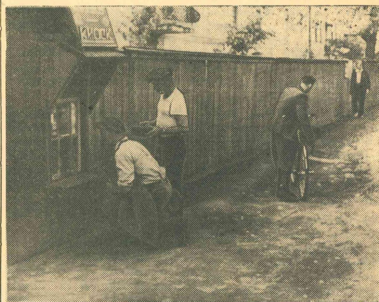
Jūs domājat, ka tie ir kumēdiji? Nē. Tāda poza, kāda redzama fotouzņēmumā, jāņem katram pircējam pie Līvānu spirta rūpnīcas kioska № 4.