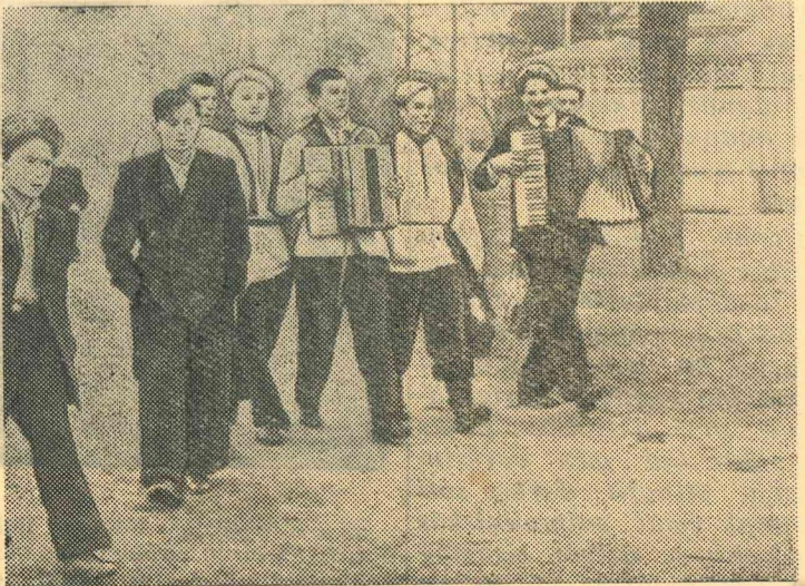
Lūk, uzņēmumā redzam grupu jauniešu. Vieni no viņiem glītos tautas tērpos savu brīvo laiku pavadā ar muziku un dziedmām, bet blakus divi jauni cilvēki vairāk līdzinās veciem. Nevar teikt, ka viņu stāja būtu glīta.