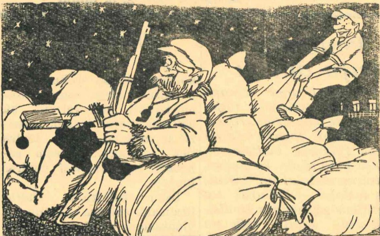
Zagliņš: Gull, vecīt, mierīgs, iztikšu bez tavas palīdzības.

Dažos rajona kolchozos necinās pret sabiedriskā īpašuma izsaiņniekošanu un sargi savu pienākumu veic pavirši. (Fakts)