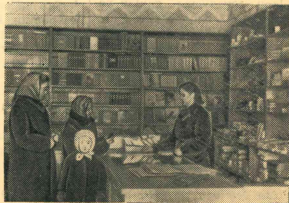
Attēlos: grāmatnīcas kopskats un iekšiene.

Ar jauno veikalu mūsu pilsētas darbaļaudis var būt tiešām apmierināti.