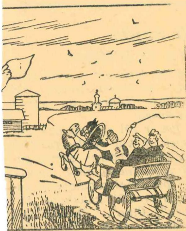
Tešiem jauni cilvēki, kas laulājas MTS mehanizatoriem St. Sprū izslēgti no komjaunatnes rindām. Fakts

Svēta kā dieva pirksts, lika kā āža rags