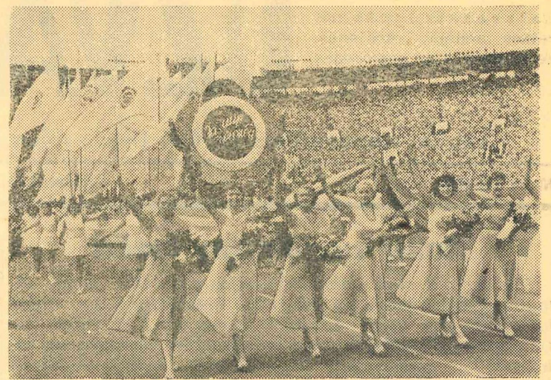
Maskava. 28. jūlijs. VI Vispasaules jaunatnes un studentu festivāls. Festivala svinīgā atklāšana V. I. Ļeņina vārdā nosauktajā Centralajā stadionā.