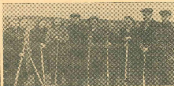
Attēlā: 1. brigādes komjauniešu grupa pēc paveiktā darba.

V. Šņukute, Līvānu MTS galvenā zootehniķe