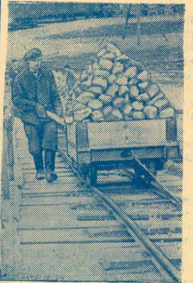
Attēlā: (augšā) vinča viegli nogādā radzi līdz krāsnij, (apakšā) radzi ieber krāsnī kopā ar antracitu.

Tā kaļķu dedzinātavas ļaudis cīnās par sestās piegādes uzdevumu pirmstermiņa izpildi.