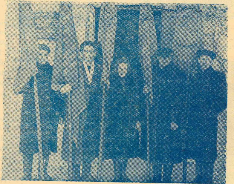
Attēlā: (augšā) Preiļu rajona un (apakšā) Līvānu rajona uzvarētāji ar izcīnītiem ceļojošiem Sarkanajiem Karogiem.