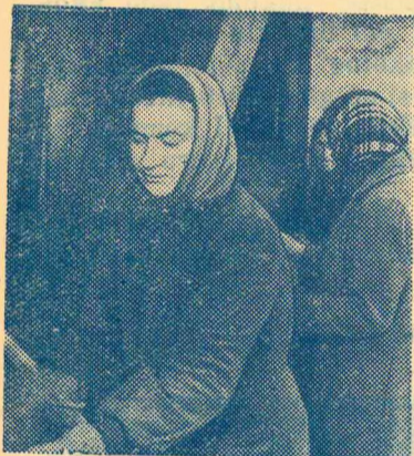
Attēlos: kūdras fabrikas „Līvāni” izolācijas segmentu cecha strādnieces darbā.