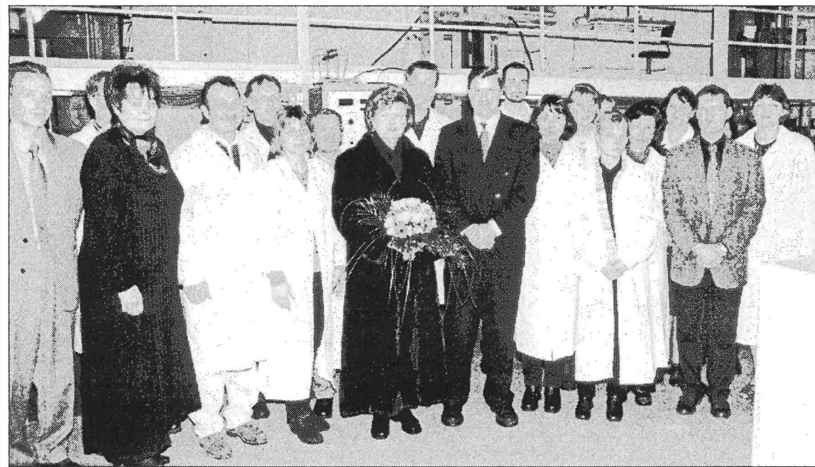
(Centrā) Valsts prezidente Vaira Vīķe-Freiberga un Daumants Pfafrods ar uzņēmuma "Anda Optec" kolektīvu