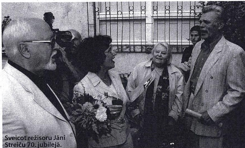
Sveicot režisoru Jāni Streiču 70. jubilejā.

Pēc skolas beigšanas Romualdu iesauca dienestā. Tur viņš dēvēts par Augustiņu, jo bieži dungojis populāro šlageri Ak, tu mīlo Augustiņi . Dažas reizes pat oficiālajos dokumentos ierakstīts kā Augusts Ancāns. Dienēja viņš Baltkrievijā, Polockas sapieru karaspēka ūdenslidēju vienībā, bija amfībijas vadītājs un ūdenslidējs. Bieži vien Romualdam nācies palīdzēt vietējai milīcijai, nirstot dažādās ūdenstilpēs un meklējot noziedznieku pamestos ieročus. Vajadzējis meklēt arī nosliktušus cilvēkus. Aktieris kolēģiem reiz stāstīja, ka pirmais slīkonis viņa ūdenslidēja karjerā bijusi no ezera dzelmes izcelta sieviete. “Jauna un skaista dāma, kuras matos bija iepinušās aļģes un dūņas. Kad vēlāk ieradās radī, viņas māte man metās virsū ar pārmetumiem, ka neesmu viņu izglābis dzīvu. Vēlāk nosliktušo sievieti vairākkārt redzēju sapņos. Viņa pūlējās ievilkāt mani dziļāk dzelmē, nožņaut un nosmacēt ar dūņām. Parasti pēc tādiem murgiem es pamodos, nosvīdis slapjš.”